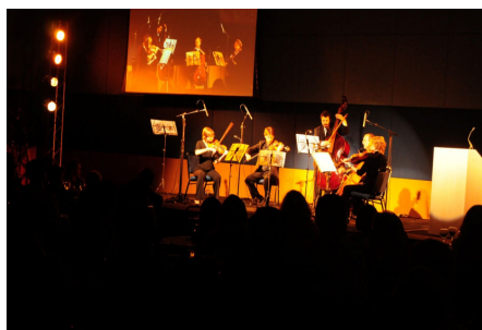
Atividade cultural no PPU 2010

semestre letivo, por meio de palestras e oficinas, além das atividades de planejamento anual de cada curso.