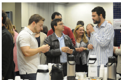
Café com Debate 2010

mensal informal, realizado na sala dos professores, para a troca de experiências e maior interação por meio de debates, leituras, estudos e manifestações artístico-culturais. A atividade é realizada no período da manhã, durante o intervalo, e no final da tarde, antes do início das aulas do período noturno. No ano de 2010 houve o lançamento do Programa de Coaching Docente com a presença do professor instrutor do Curso de Formação em Coaching Docente; confraternização por ocasião do Dia do Professor, com apresentação do Coral Universidade Positivo e de música popular brasileira; apresentação musical com professores que cantam e tocam instrumentos musicais; e, para encerramento do ano letivo, um momento de confraternização com motivo natalino e apresentação de um Coral Infantil da cidade de Curitiba.