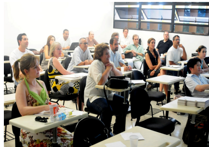
Oficina do PPU 2010