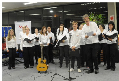
Apresentação do Coral da Universidade

Para o ano de 2011 estão previstas as atividades abaixo: