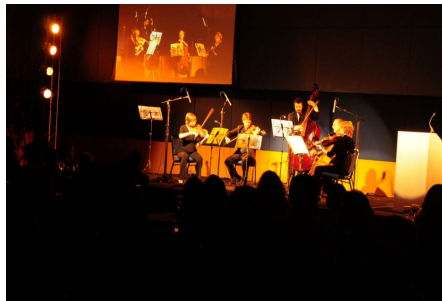
Atividade cultural no PPU 2010

semestre letivo, por meio de palestras e oficinas, além das atividades de planejamento anual de cada curso.