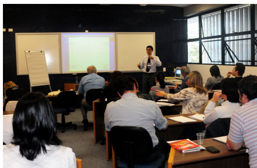
Curso de Formação em Coaching Docente

Para efetivar este programa a Pró-Reitoria de Graduação ofereceu um curso de formação para 20 professores, indicados pelos coordenadores de cursos e que possuem tempo integral na instituição.