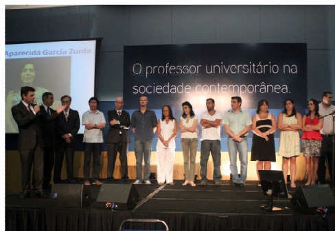
Professores sendo homenageados pelo Pró-Reitor de Graduação com o Prêmio Meritocracia em janeiro de 2011